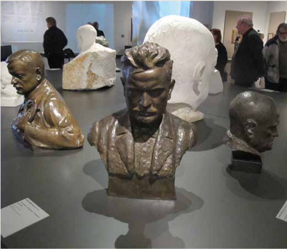
Ateneumin näyttelyssä on myös runsaasti muotokuvia ja veistoksia, joita Sibeliuksesta tehtiin. Toisissa on tulisilmainen nuorukainen otsatukkansa alla, toisissa ryppyotsainen kalju valtiomies, jolta ei enää sävellyksiä syntynyt, ainakaan valmiiksi asti.