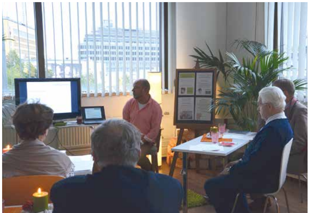
Helsingin Eteläpohjalaisten hallitus pääsi kokoustamaan Ruohonjuuren toimistolle Kampissa syyskuussa.